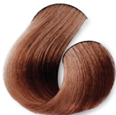
Louro Dourado CÓD.1030