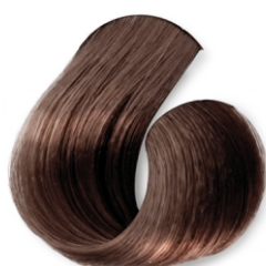
Louro Escuro Cobre Acinzentado (Toffee) CÓD.1035