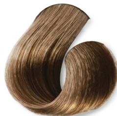
Louro Muito Claro Bege Dourado (Folha Seca) CÓD.1032