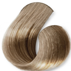
Louro Muito Claro Bege Acinzentado CÓD.1031