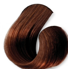
Louro Claro Dourado Cobre CÓD.1034