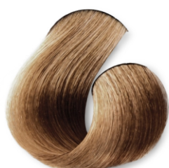
Louro Muito Claro Bege Dourado Suave CÓD.1041