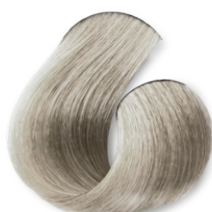
Louro Ultra Claro Pérola (Champagne) CÓD.1037