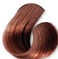
Louro Claro Cobre Intenso CÓD.1033