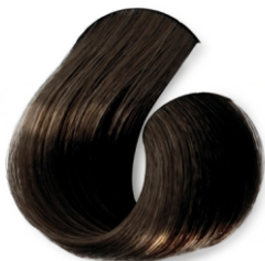
Castanho Escuro CÓD.1011