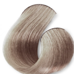
Louro Claríssimo Irisado Acinzentado Suave CÓD.1043