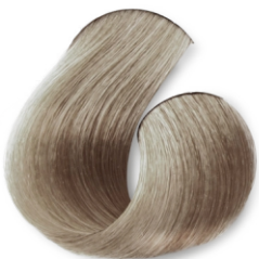
Muy Rubia Perla clara CÓD.1036