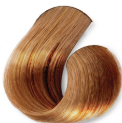
Rubio muy claro Marrón dorado Suave CÓD.1042