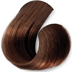
Rubio Castaño Oscuro Acaju (Canela Intensa) CÓD.1022