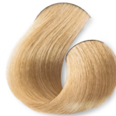
Rubia Brillante CÓD.1018