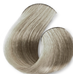
Rubia Brillante Perla Suave CÓD.1044