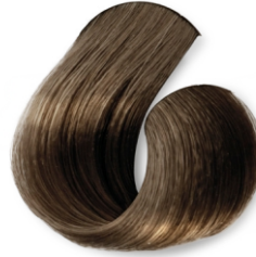
Louro Médio Intenso Marrom Acinzentado CÓD.1023