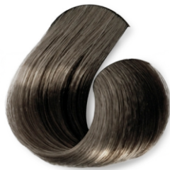
Rubio Ceniza Claro CÓD.1026