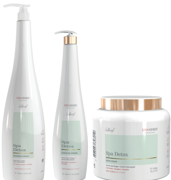
CODICE 8002 CODICE 8026 CODICE 8019

Trattamento di origine vegetale per favorire la pulizia e la purificazione del cuoio capelluto e dei capelli.