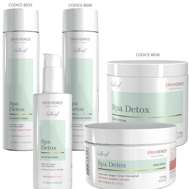
CODICE 8033 CODICE 8040 CODICE 8058 CODICE 8064 CODICE 8057