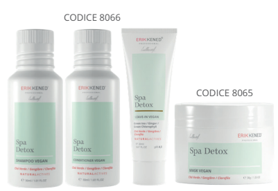
CODICE 8066 CODICE 8067 CODICE 8068 CODICE 8065